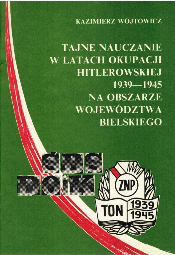
Kazimierz Wójtowicz: Tajne nauczanie...ZNP Zarząd Okręgu Bielsko-Biała. Bielsko-Biała 1991.